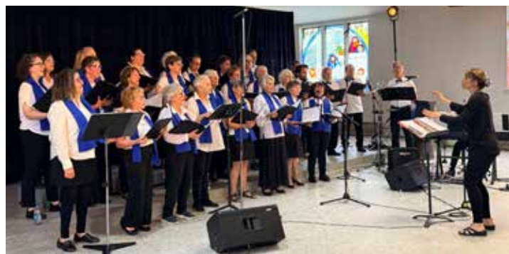
Chorale Le Coeur de St-Denis.

Rédactrices invitées : Des choristes du Coeur de St-Denis