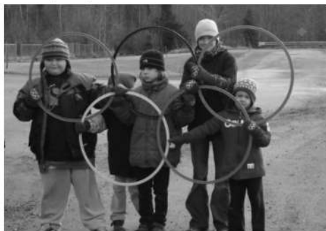
Les fameux anneaux olympiques représentant les 5 continents participant aux Jeux

Comme ce n'est pas tous les jours qu'on reçoit un symbole international, la commission scolaire de la région sherbrookoise (CSRS) eut la brillante idée d'organiser une activité de très grande envergure afin que les écoles vivent une journée d'allégresse et que l'esprit olympique s'ancre quelque part dans les cerveaux émotifs ! Un partage public de la richesse planétaire en quelque sorte.