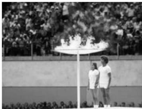
Flamme et vasque olympiques – Jeux de Montréal 1976