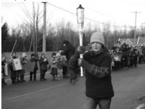
Dans le feu de l'action...

Le matin, Alfred-Desrochers (l'école de St-Élie pas le poète sinon sa barbe aurait pris feu) nous apportait le flambeau et nous communiquait la fièvre de type O. Ensuite, un porteur ou une porteuse, qui avait été retenu sur leur détermination dans toutes les matières scolaires, représentait chaque classe lors d'une course à relais devant une haie d'honneur formée du personnel, des parents et bien-sûr de tous les élèves. Ces derniers avaient préparé avec leur enseignant-te des instruments pour faire du bruit, et étaient équipés d'affiches, de slogans d'encouragement ainsi que de drapeaux ornés des 5 anneaux olympiques et d'une multitude de pays.